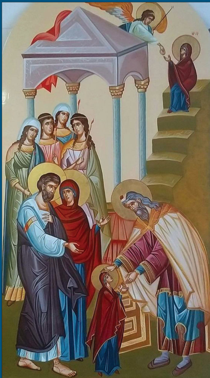
Entrée au Temple de la Très Sainte Mère de Dieu