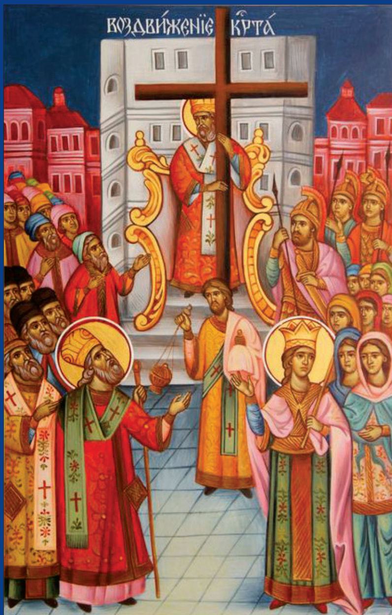
Exaltation de la Très Sainte Croix