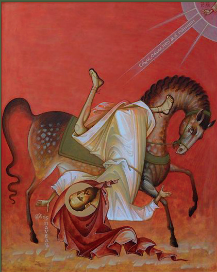
Conversion de saint Paul