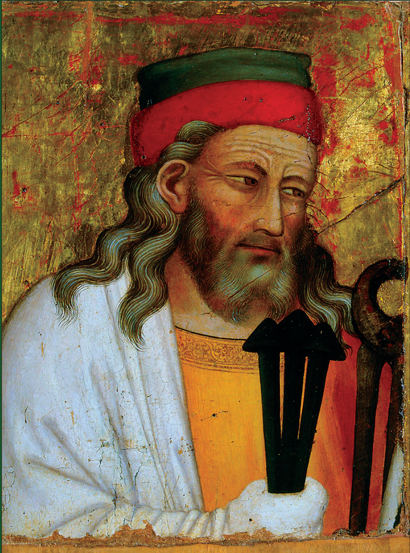
Saint Joseph d'Armathie